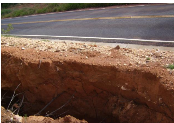
Figura 04. Processo erosivo

Cabe salientar, no entanto, que mesmo utilizando o AIA, nem sempre todos os impactos são identificados, podendo ocorrer impactos imprevistos que venham a ocorrer ao longo do tempo.