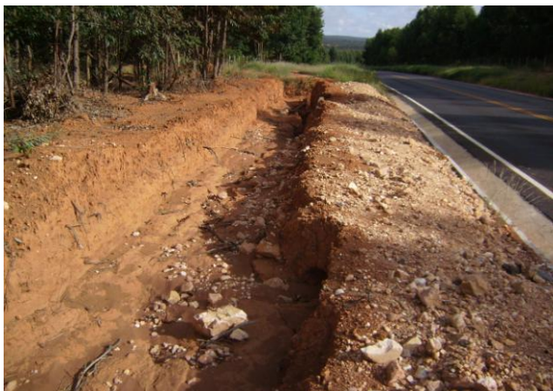
Figura 03. Processo erosivo