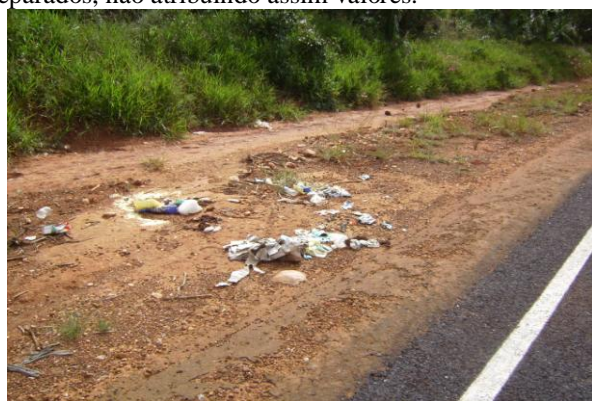
Figura 02. Geração de resíduos

Oliveira, (2007) enfatiza que a matriz de Leopold apresenta vantagens no que diz respeito: necessidade de poucos dados para elaboração; abrangência dos fatores ambientais físicos, biológicos e socioeconômicos; comunicação dos resultados de forma compreensível; constitui guia inicial para prosseguimento de projetos e estudos futuros e trata dados qualitativos e quantitativos. E desvantagens com relação á variável tempo, esta por sua vez não é considerada, uma vez que não prevê impactos imediatos, temporários nem definitivos. Cita ainda que essa metodologia compartimentariza o ambiente em meios separados, não atribuindo assim valores.